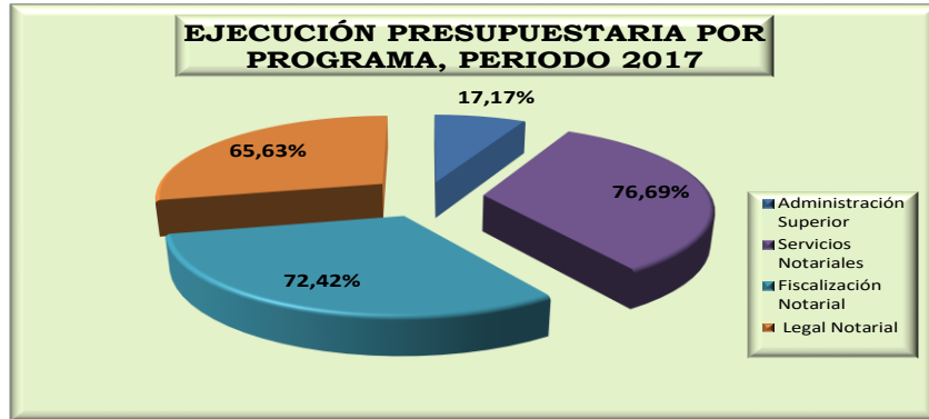
GRÁFICO DE EJECUCIÓN PRESUPUESTARIA DE LAS METAS DEL POI 2017